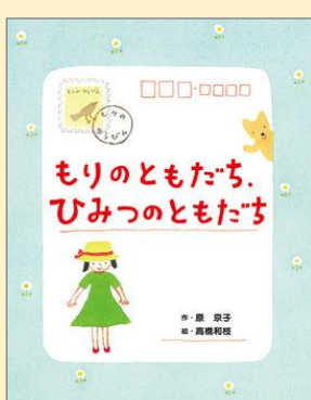
『もりのともだち、ひみつのともだち』 原 京子／作 高橋 和枝／絵 (ポプラ社)

ナナちゃんのお向かいのうちのおばあさん、モモコさんは、自分は300歳の「まじよ」だといひます。ほんとかな？ ナナちゃんは興味津々で…。お年寄りと子どもの交流を描いた、心あたたまる楽しいお話です。