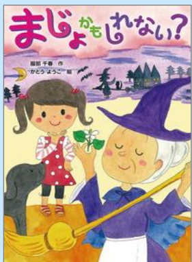
『まじよかもしれない？』 服部 千春／作 (岩崎書店)

小学校に入学して1～2年。少しずつひとりで本を読む力が芽生えてきたかな？その一方で、子どもたちにとって「読書につながる読み聞かせ」が大切な時期でもあります。図書館では、どちらでも楽しめる本を数多く取り揃えています。本が親子の絆を深めるツールとなり、そして子どもたちの心を豊かにする原動力になればいいな。そんな想いを込めて、おすすめの本を選びました。