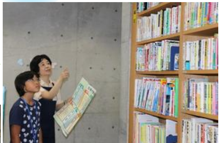
本の配置について学びます