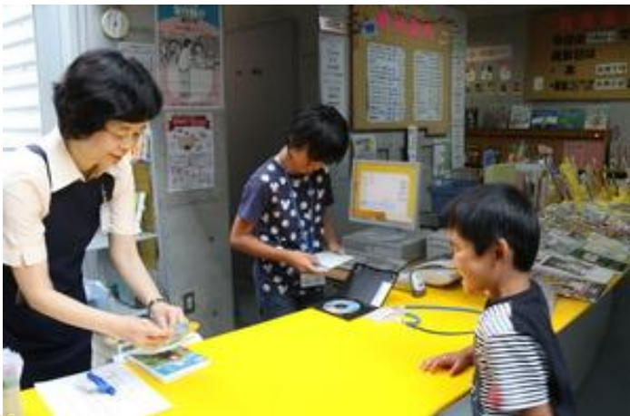
本やCDの返却や貸し出しをしました