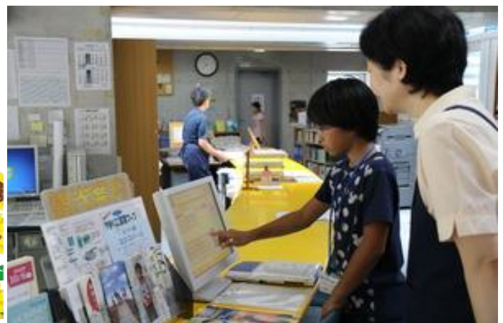
本を検索しました