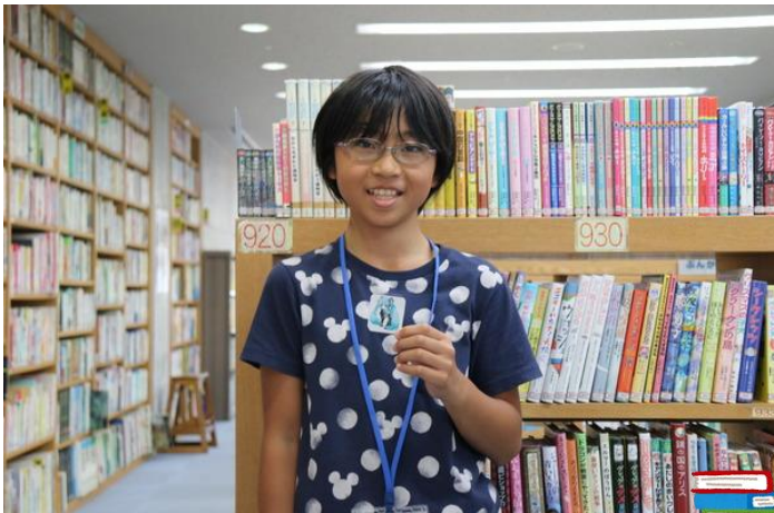
一日図書館員を頑張りました

（「一日図書館員」は図書館の仕事を体験して図書館のはたらきや資料の利用法を体得してもらうことを目的としています。）